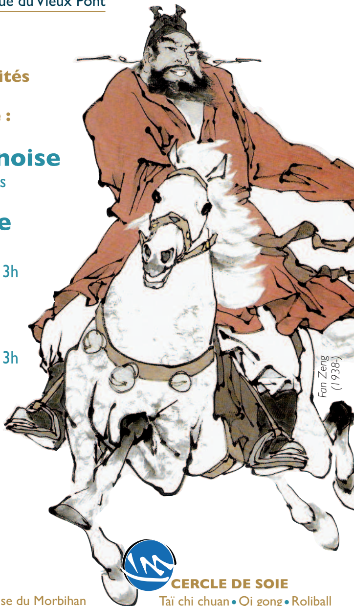
Fan Zeng (1938-)