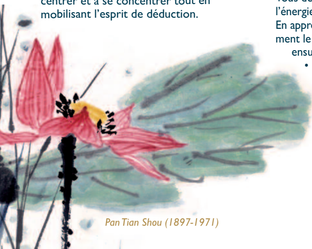
Pan Tian Shou (1897-1971)

C'est une activité qui aide à se recentrer et à se concentrer tout en mobilisant l'esprit de déduction.